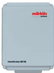
Transformador de alumbrado seguro, ref. 60052

Usted entrega su antiguo transformador (antes explicado) a un distribuidor especializado Märklin y este le vende un transformador con las nuevas tecnologías de seguridad, a un precio reducido.