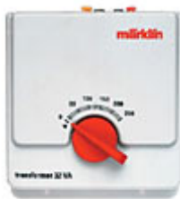
Seguro y actual, el transformador ref. 6647

Todos los transformadores están fabricados bajo normas muy estrictas de seguridad. Durante los últimos años, estas normativas se han modificado, tendiendo a ser más rigurosas. La seguridad del usuario y la protección del voltaje saliente y entrante, son unas de las prioridades más importantes.