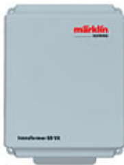
Transformador de alumbrado seguro, ref. 60052

Usted entrega su antiguo transformador (antes explicado) a un distribuidor especializado Märklin y este le vende un transformador con las nuevas tecnologías de seguridad, a un precio reducido.